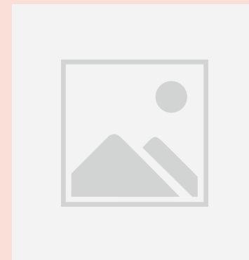
ภาพมัคคุเทศก์กัมพูชา