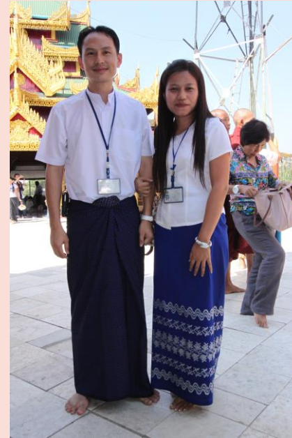
ภาพมัดคุเตศ์เมียนมาร์