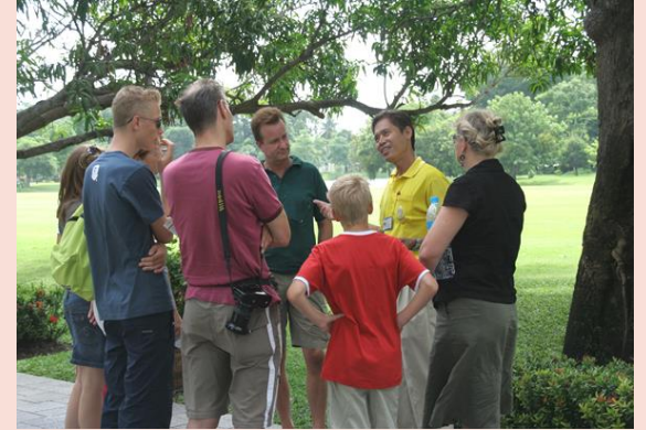
ภาพมัคคุเทศก์กำลังนำชมพระราชวังบางปะอิน