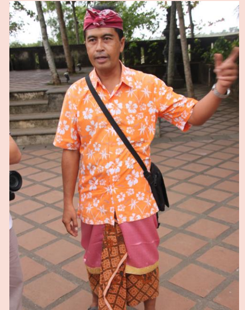
ภาพมัดคุเตศ์ อินโดนีเซีย