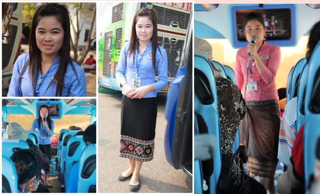
ภาพมัคคุเทศก์สาธารณสุขประชาชนไทยประชาชนลาว