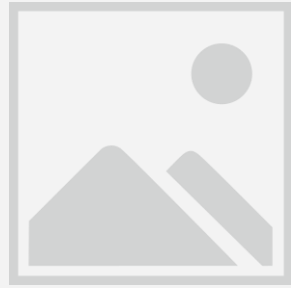
ภาพการแต่งกายของมัคคุเทศก์ไทย