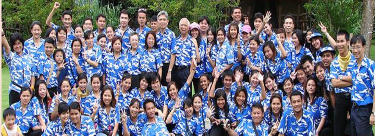
ภาพยูนิฟอร์มมัดคุเตศ์บริษัทหนุ่มสาวทัวร์