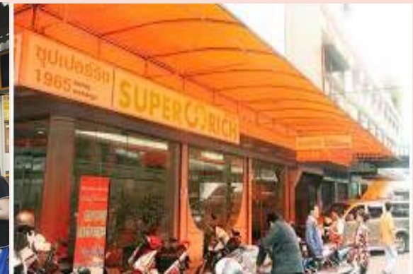
ภาพนักท่องเที่ยวกำลังต่อแถวเพื่อแลกเปลี่ยนเงิน / สถานที่แลกเปลี่ยนเงินชื่อดัง