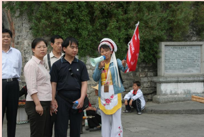
ภาพมัดคุเตศ์ท้องถิ่นเมืองลี่เจียง ประเทศจีน