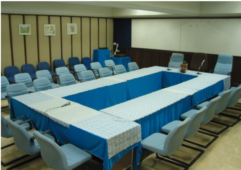
ห้องประชุม