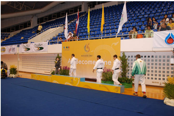
แท่นรับเหรียญรางวัล