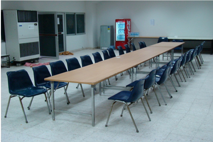
ห้องพักนักกีฬา