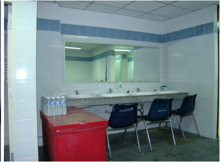
ห้องเปลี่ยนเครื่องแต่งกายนักกีฬา