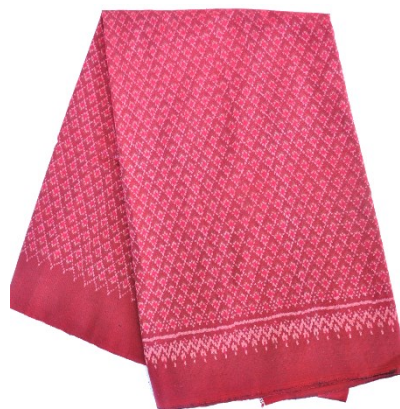
ผ้าฝ้าย ลายสร้อยดอกหมาก