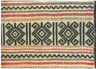
ชิตลายไลแฉงปอง