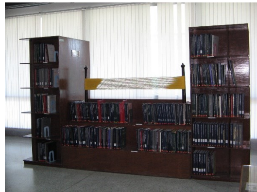
ชั้นหนังสือรูปทรงหลักหมี่