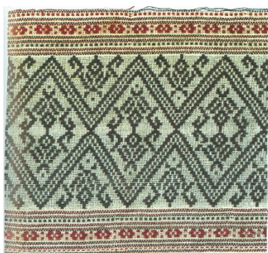
ผ้าขิด ลายขอ ขาปู