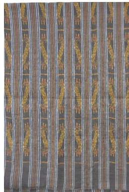
ผ้าไหมมัดหมี่ ลายขอ