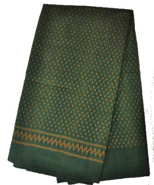
ผ้าไหมมัดหมี่ ลายบักจับหวาน