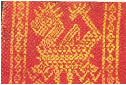
ชิตลายง้างสิงห์