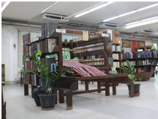
ชั้นหนังสือรูปทรงก็ทอผ้า

ศูนย์สารนิเทศอีสานสิรินธร นำโครงสีเหลี่ยมของก็ทอผ้าไปจัดทำเป็นชั้นวางหนังสือ โดยใช้พื้นที่ระหว่างเสาคี่ด้านยาวเป็นที่วางหนังสือ นอกจากนี้ยังนำหลักหมี่หรือโฮงหมี่ ซึ่งเป็นอุปกรณ์หนึ่ง ในการมัดเส้นไหมหรือฝ้ายเป็นลวดลายเพื่อนำไปย้อม มาเป็นแบบในการจัดทำชั้นหนังสือรูปทรงหลักหมี่ และนำผ้าไหมลวดลายเอกลักษณ์ต่างๆ มาประดับตกแต่งชั้นหนังสือ