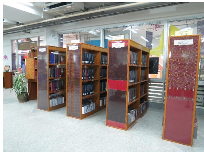
ชั้นหนังสือตกแต่งด้วยผ้าทอพื้นบ้านอีสาน