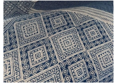
ผ้าชิตย้อมคราม

ผ้าชิต เป็นการทอผ้าที่ใช้กรรมวิธีสร้างลวดลายโดยการทอ ยกเส้นหลักหรือเส้นเครือด้วยไม้แบนปลายเรียวมนแล้วสอดเส้นสาน หรือเส้นทอเข้าไปตามร่องไม้ที่ยกเอาไว้แล้วนั้น ความแตกต่างของสี จากเส้นสานและเส้นหลักที่ขัดประสานกันทำให้เกิดเป็นลายรูป แบบ ต่าง ๆ อย่างคมชัด ชิตหมายถึง การมัดหรือการซ้อนขึ้น ลายชิตที่ แพร่หลาย อาทิ ลายหน่วยย ลายดอก ลายขอหรือชิตขอ ลายกาบ ลายสัตว์