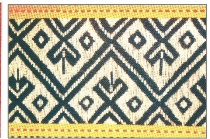
ชิตลายไผ่ฝ้าย